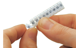
Trennen eines Einzelschildchens vom WMB-Beschriftungsstreifen, für größere Klemmenbreiten