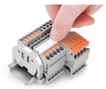
Einrasten eines WMB-Beschriftungsstreifens in die Beschriftungsaufnahme