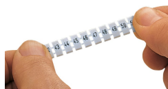
Strecken eines WMB-Beschriftungsstreifens