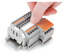
Einrasten eines WMB-Beschriftungsstreifens in die Beschriftungsaufnahme