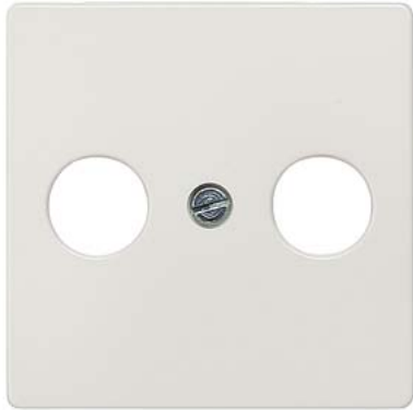
DELTA i-system titanweiß Abdeckplatte Abdeckplatte TV/RF/SAT , 2-Loch 55x55mm