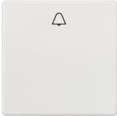
DELTA i-system titanweiß Wippe mit Symbol Glocke 55x55mm