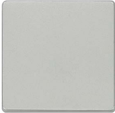
DELTA i-system aluminiummetallic Wippe neutral 55x55mm