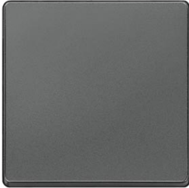
DELTA i-system carbonmetallic Wippe neutral 55x55mm