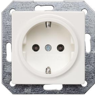
DELTA i-system titanweiß SCHUKO 55x55mm 10/16A 250V