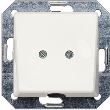
DELTA i-system titanweiß Auslassplatte 55x55mm