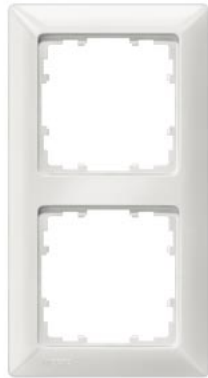
DELTA line titanweiß Rahmen 2-fach, 151x80mm