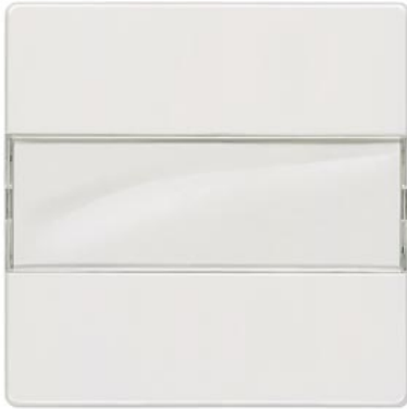
DELTA i-system titanweiß Wippe mit Schriftfeld 55x55mm