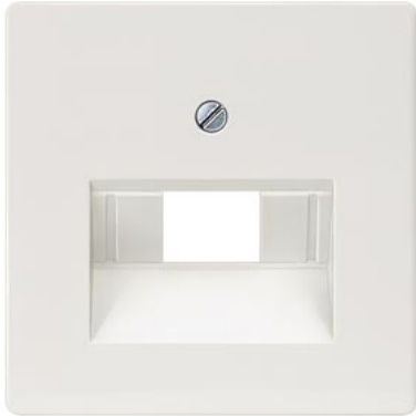
DELTA i-system titanweiß Abdeckung UAE-Kat.3, 1- und 2f 55x55mm