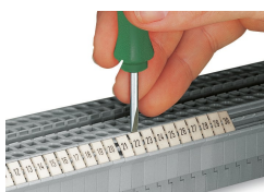
Einrasten eines WMB-Beschriftungsstreifens in die Beschriftungsaufnahme