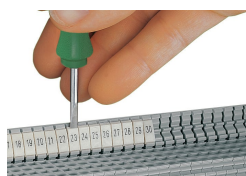
Einrasten eines WMB-Beschriftungsstreifens in die Beschriftungsaufnahme des Doppelschildträgers