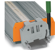
Die Endklammer von der Tragschiene lösen.