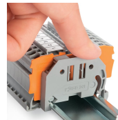
– und das Ganze sitzt!